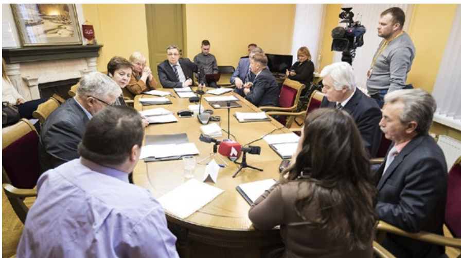
■ Mandātu, ētikas un iesniegumu komisijas sēde

Saeimas Mandātu, ētikas un iesniegumu komisijai. Uz Prezidija sēdi uzaicināma persona, kas pilnvarota pārstāvēt kolektīvā iesnieguma iesniedzējus, bet pilnvarotās personas klātbūtne nav obligāta kolektīvā iesnieguma izskatīšanai. Ja Prezidijs konstatē, ka iesniegtais dokuments neatbilst Saeimas kārtības ruļļa prasībām, atbildi uz to sniedz saskaņā ar Iesniegumu likumu.