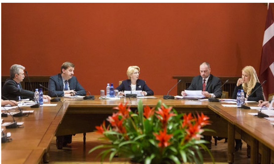
■ Saeimas Prezidija sēde

Iesniegumi ir būtisks informācijas avots, ko Saeima izmanto savā ikdienas darbā. Tādēļ, lai paplašinātu iedzīvotāju līdzdalību likumdošanā, Saeima ir paredzējusi, ka ne mazāk kā 10 000 pilsoņu var vērsties parlamentā ar kolektīvo iesniegumu.